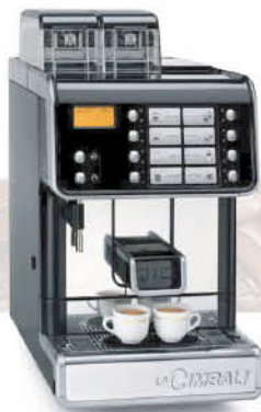
LA CIBALI Q10 超級全自動咖啡機