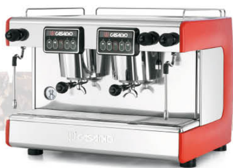
CASADIO dieci 系列 半自動咖啡機