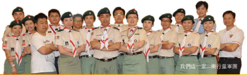
我們這一家...樂行童軍團

人生七十古來稀，人的一定要度過七十個寒與暑，本已不是一件容易的事，何況要讓一個團由創團至今薪火相傳了七十年，更是一件難能可貴的美事。2011年對於一群熱心的年輕人，是不可多得、難以忘懷的一年！今年是九龍第二十一旅樂行童軍團成立七十周年，就讓這群年輕人以一連串的活動來重溫這些年來，本旅樂行童軍團的點滴。是次的紀念活動共分為四大部分，分別為「澳門文化交流之旅」、「長幼同心慶七十」、周年紀念特刊及周年慶祝晚宴。