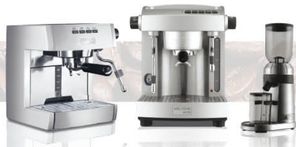
WELHOME WPM 惠家專業產品系列 WELHOME Professional Machines